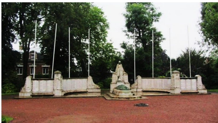
Monument aux Morts de Valenciennes.

Morts pour la France Site Mémoire des Hommes