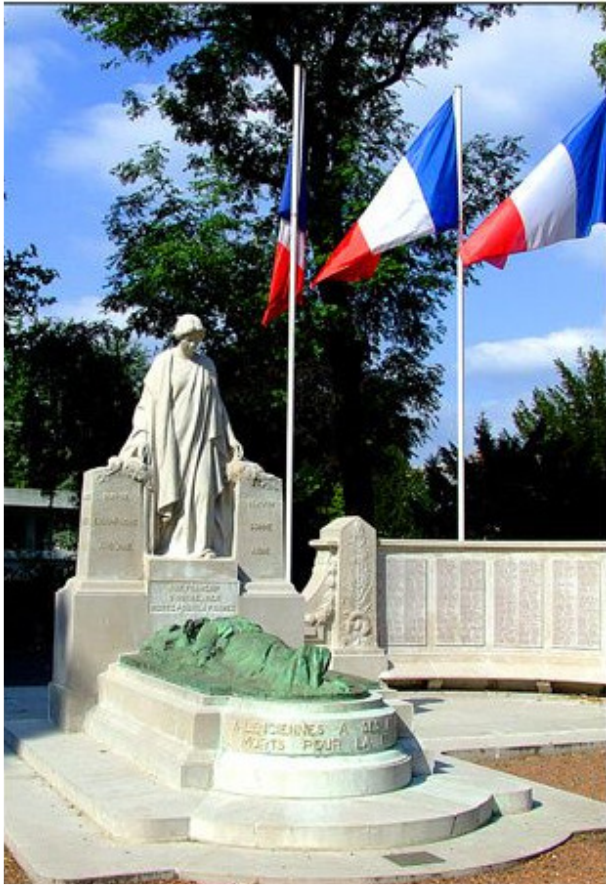
Monument aux Morts de Valenciennes Photo Alexandre VALLEZ 2007.