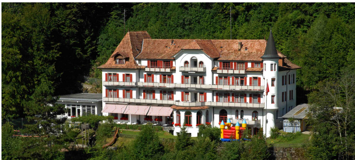
Le Schlosshôtel à Wilderswil (Suisse), de nos jours.

Son adresse en 04.1918 est Schlosshôtel – Wilderswil – Interlaken .