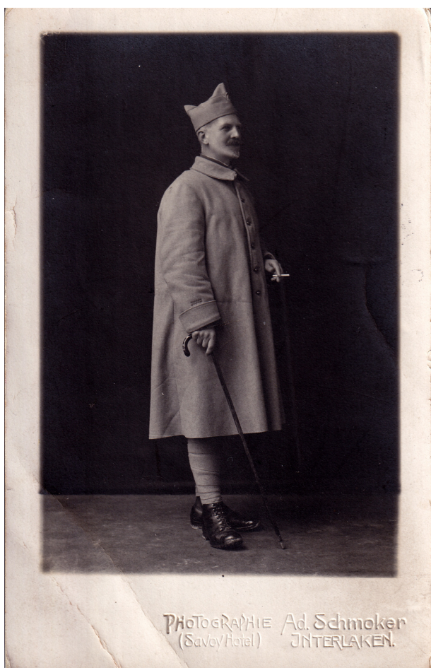
7 avril 1918