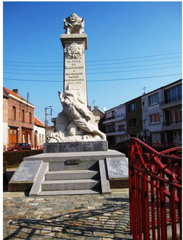
Monument aux Morts de Marchiennes (Nord)