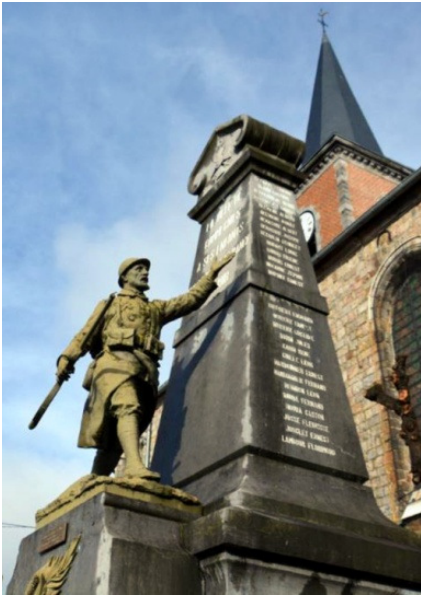
Monument de Gommegnies