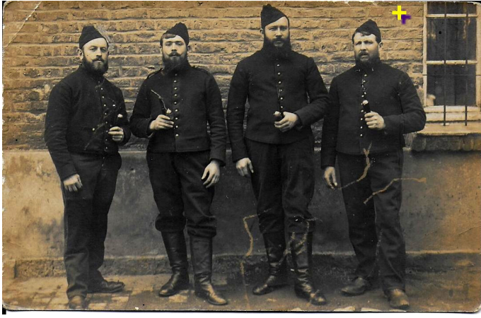
27 février 1916