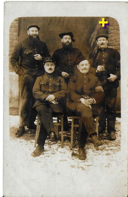
6 janvier 1918