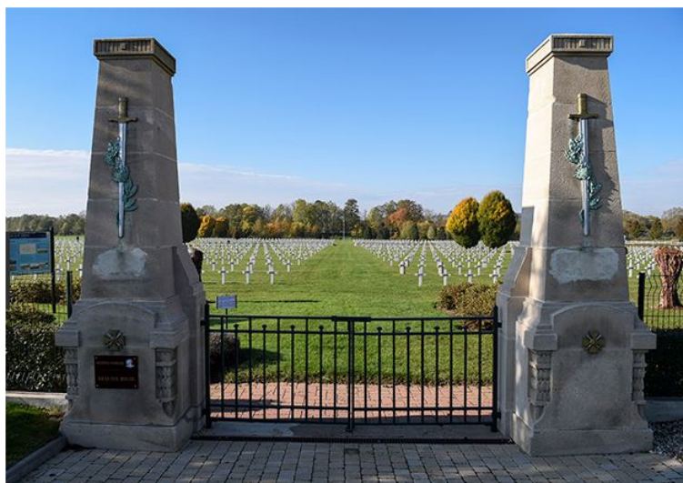
Nécropole Nationale de Bras-sur-Meuse.

Plus tard, sa dépouille a été transférée à la Nécropole Nationale de Bras-sur-Meuse, tombe 995.