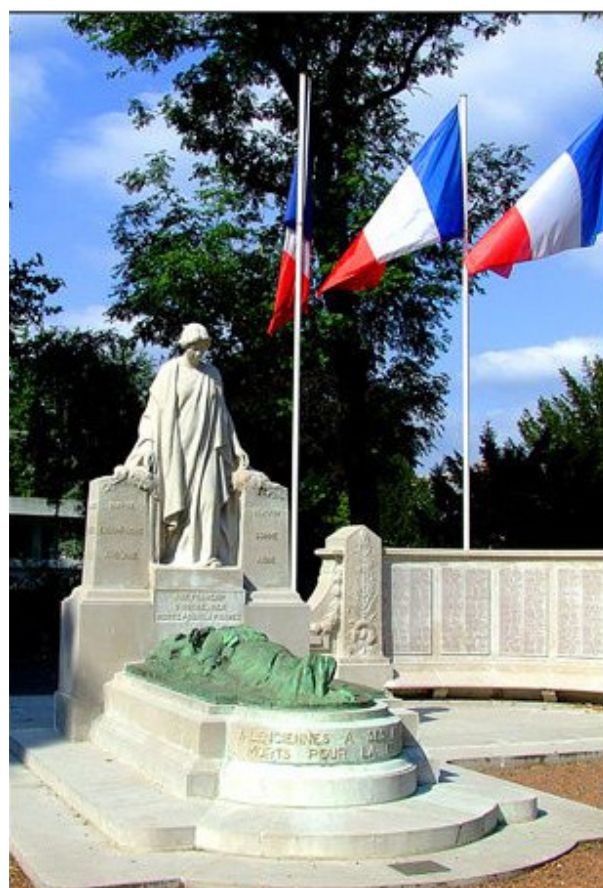
Monument aux Morts de Valenciennes.