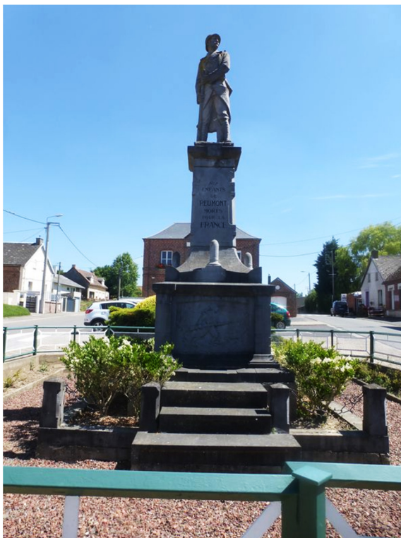
Monument aux Morts de Reumont

Il est inscrit sur les monuments aux morts de Reumont, son village natal, et de Condé-sur-l'Escaut sa ville de résidence et de garnison.