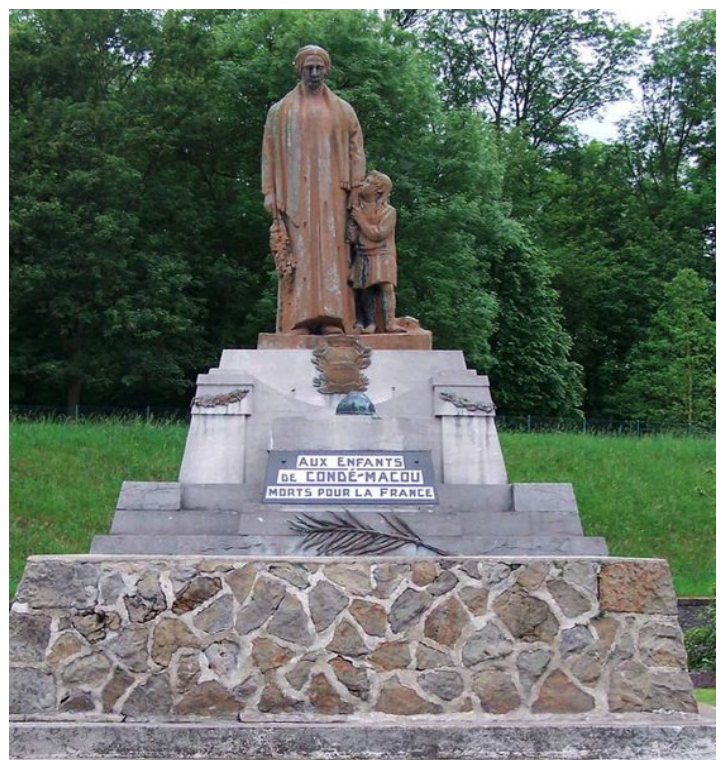
Monument aux Morts de Condé-sur-l'Escaut