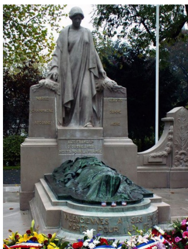
Monument aux Morts de Valenciennes