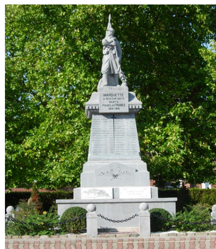
Monument aux Morts de Marquette-en-Ostrevant