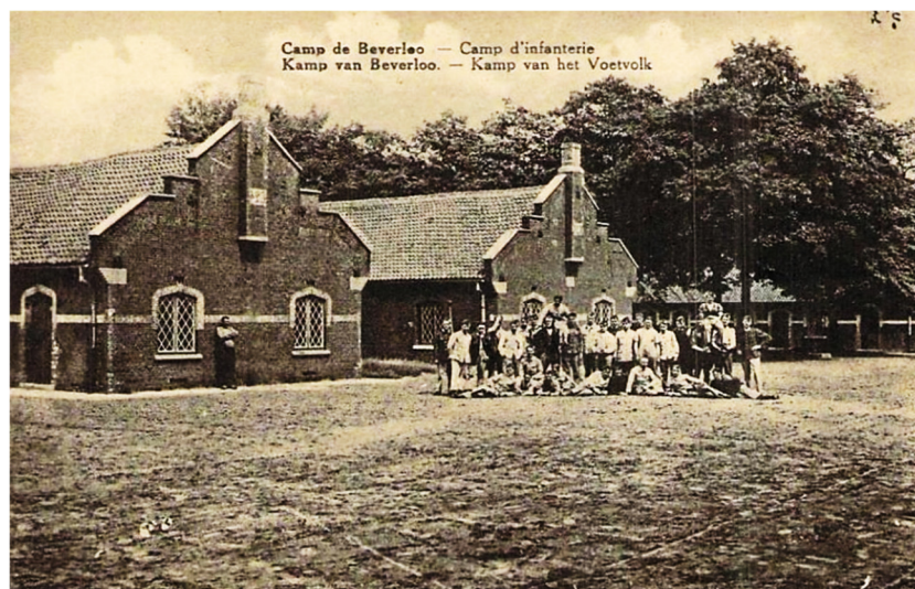
Camp d'Infanterie de Beverloo (B)

Fernand prend alors le train pour gagner Mons, emportant dans son sac de paquetage tous les effets perçus à son incorporation.