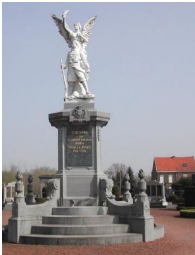
Monument aux Morts de Crespin photo Didier MAHU.