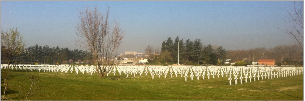
Nécropole nationale « La Doua »

Campagne contre l'Allemagne du 7 janvier 1916 au 12 décembre 1917.