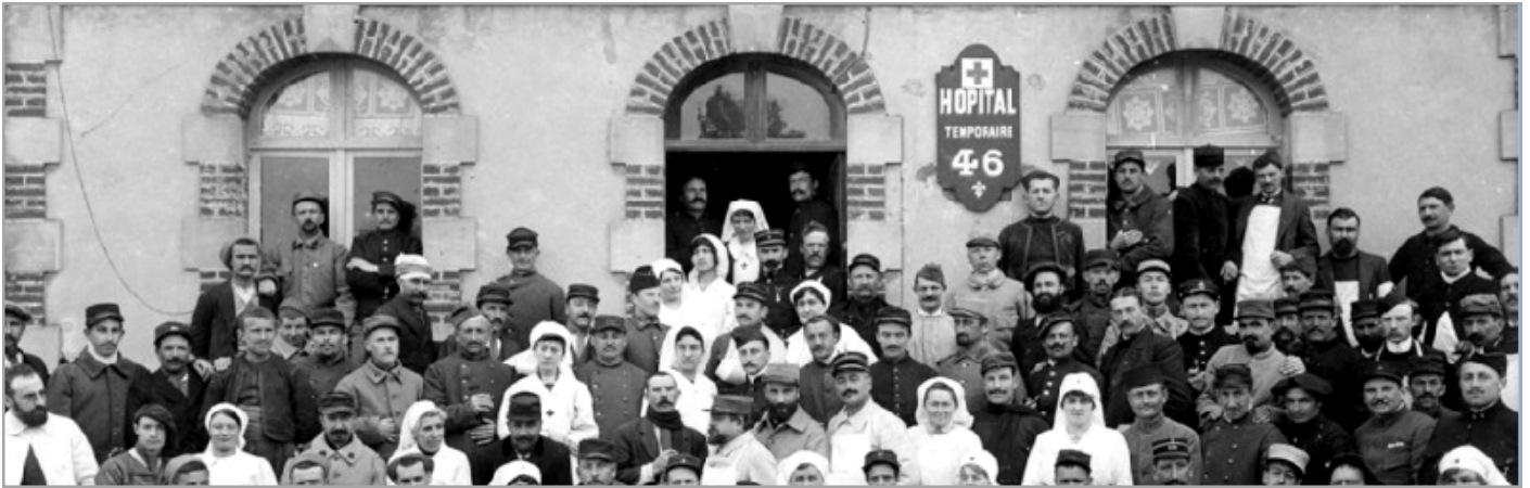
Hôpital temporaire n° 46 à Ouistreham (Calvados) Installé dans l'Hôtel « Le Cosy » anciennement « Le Châtelet » 4

Citation par Ordre du Général commandant le xx C.A. du 16.08.1916 :