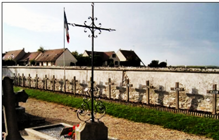
Le Carré militaire à Saint-Souplets (S.et.M.)

Son nom figure sur les Monuments aux Morts de Wargnies-le-Grand et de Saulzoir (Nord), et sur un monument commémoratif à Saint-Souplets.