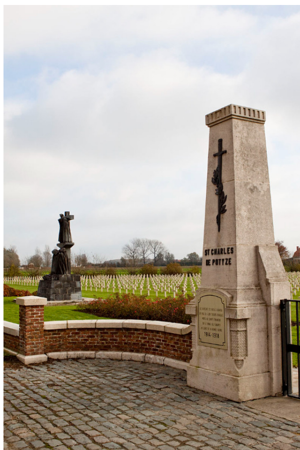
Nécropole Saint-Charles de Potyze