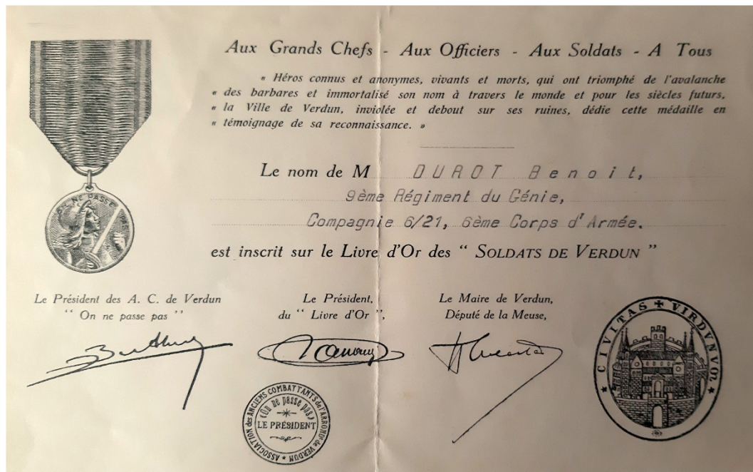
DUROT Benoît – Livre d’Or de Verdun