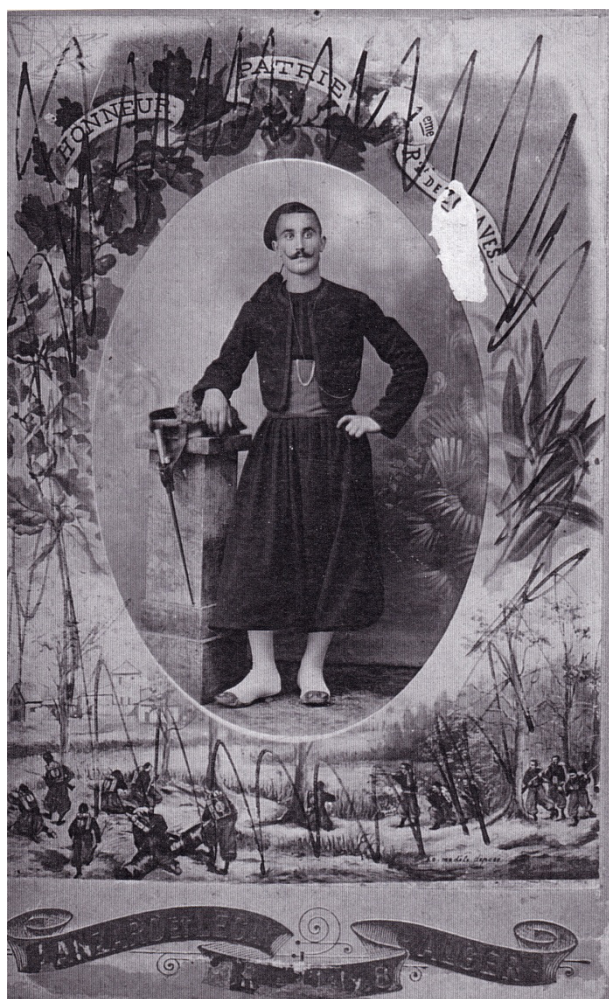
el GARMIER au 1 er Régiment de Zouaves en Algérie

Mobilisé et dirigé sur le 1 er Régiment de Zouaves (R.Z.) en Algérie le 08.10.1906.