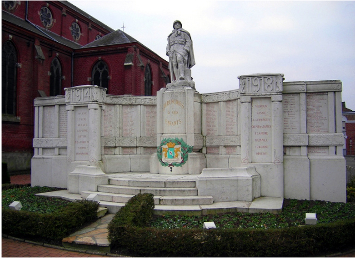
Monument aux Morts de Pérenchies (Nord)

Son nom figure sur le Monument aux Morts de Pérenchies.