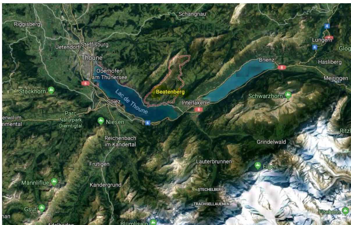
Beatenberg sur le lac de Thoune Carte Google Map