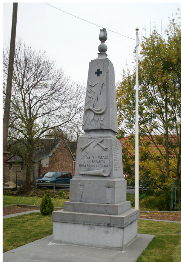
Son nom figure sur le Monument aux Morts de Saint-Vaast-en-Cambrésis

21/09/2009