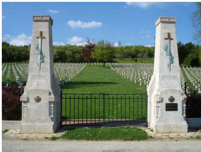
Nécropole Nationale « Glorieux »