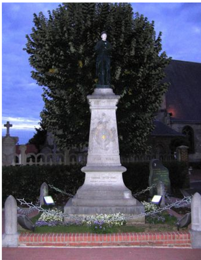
Son nom figure sur le Monument aux Morts de Saint-Aubert (Nord)

Campagne contre l'Allemagne du 03.08.1914 au 09.08.1917.