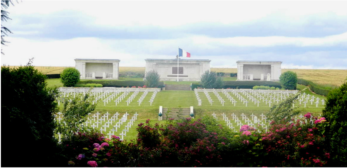
Nécropole nationale « Serre-Hébuterne » - http://aec-betz.over-blog.net/

Alfred Claude LARCHEVEQUE est inhumé, dans la tombe individuelle n° 30, de la Nécropole nationale « Serre-Hébuterne », à Beaumont-Hamel (Somme). Cette nécropole contient les corps de 834 hommes des 243 e et 327 e Régiments d'Infanterie, tués pendant les combats d'Hébuterne.