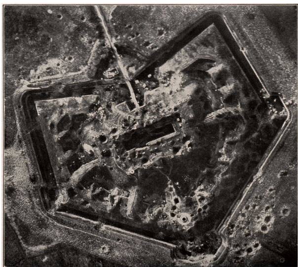
Das Fort Cerfontaine der Festung Maubeuge, gefallen am 7. September 1914 Die Belagerung der Festung hatte für längere Zeit ein ganzes Armeekorps in Anspruch genommen

Affecté à la 15 e Batterie 5 e Pièce au Fort de Cerfontaine, (Nord).