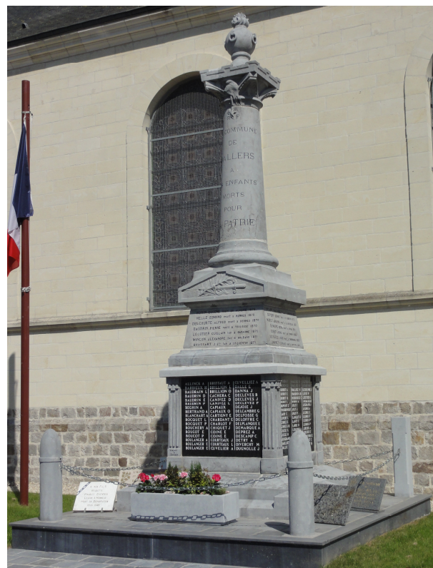
Monument aux Morts de Wallers

Son nom figure sur le Monument de Wallers.