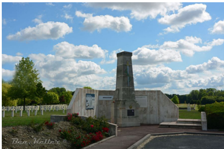
Nécropole nationale Le Pont du Marson (Marne)

Il est enterré à la Nécropole nationale Le Pont du Marson (commune de Minaucourt-le-Mesnil-lès-Hurlus)