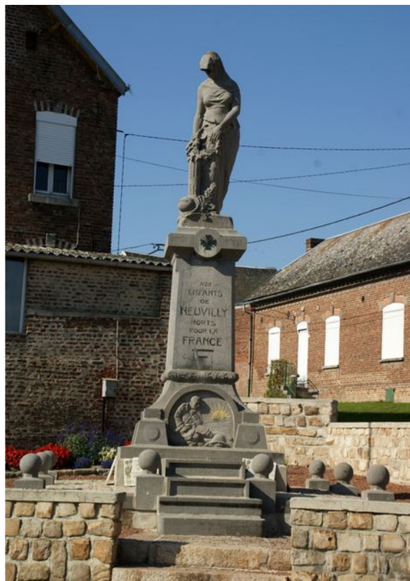
Monument aux Morts de Neuvilly (Nord)

Morts de la Première Guerre - Site Mémoire des Hommes