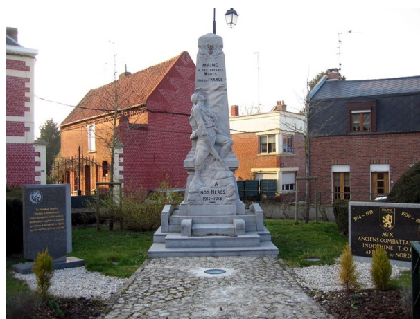
Son nom figure sur le Monument aux Morts 4 de Maing.