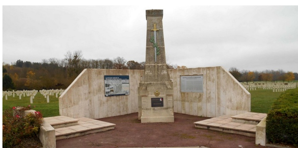
Nécropole nationale Le Pont du Marson (Minaucourt-le-Mesnil-lès-Hurlus) 3

« Louis » LEFEBVRE est inhumé dans la Nécropole Le pont de Marson , tombe 5131.