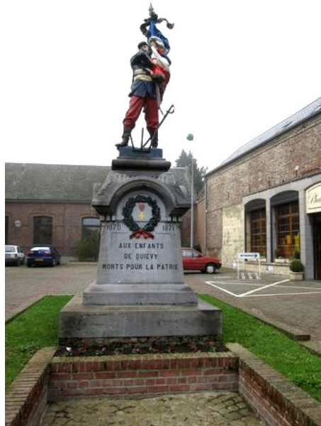
Monument aux Morts de Quiévy (Nord) 10/12/2009