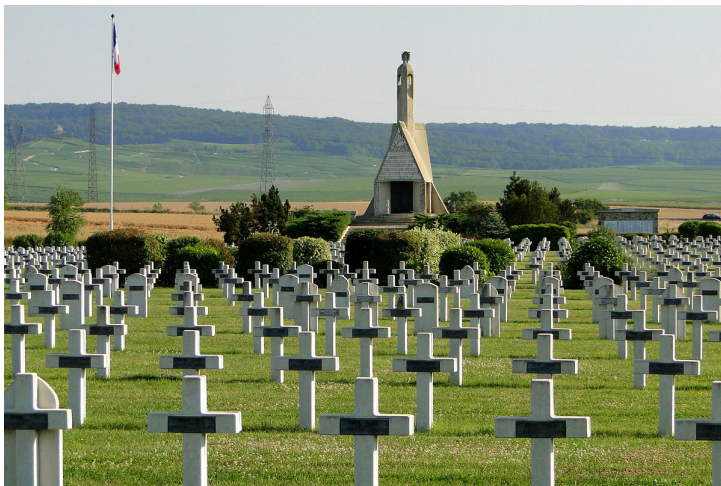
Nécropole Nationale de Sillery (Marne)