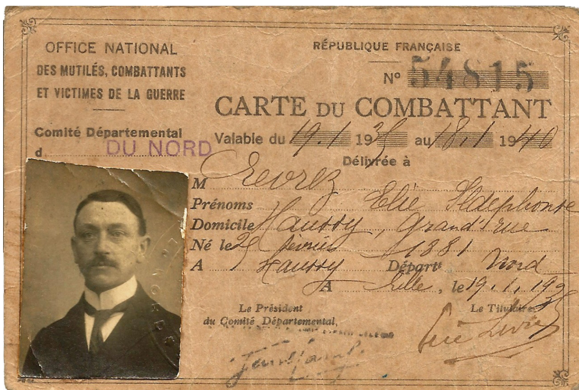
Carte du Combattant - 19.01.1935