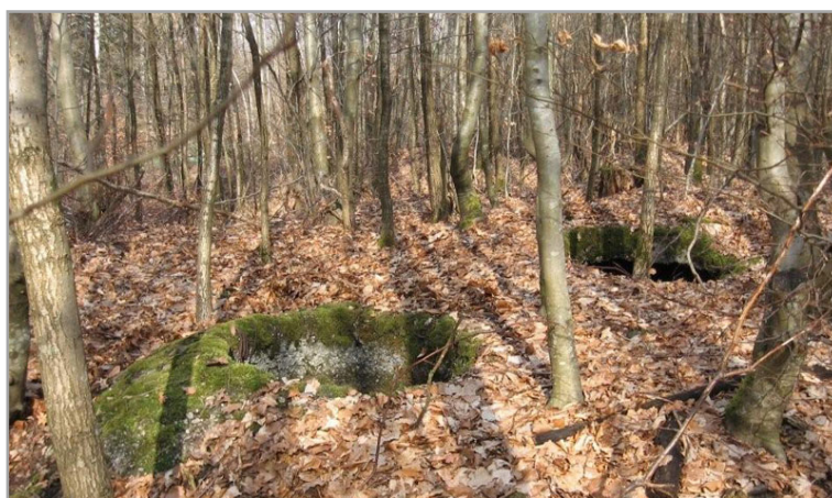
Le bois de la Gruerie - https://www.lamarne14-18.com/

Campagne contre l'Allemagne du 3 août 1914 au 3 juillet 1915