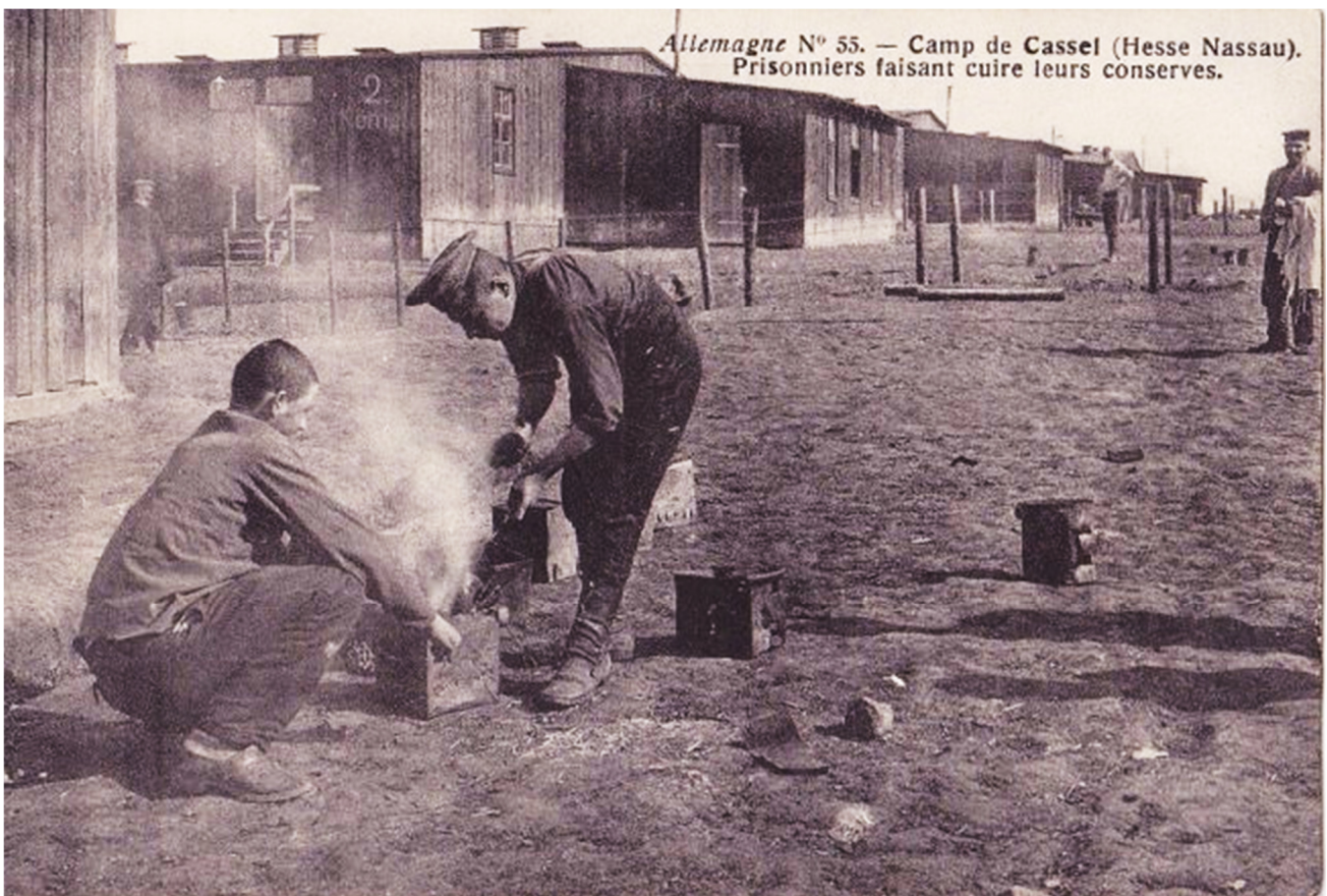
Camp de Cassel, prisonniers faisant cuire leurs conserves.