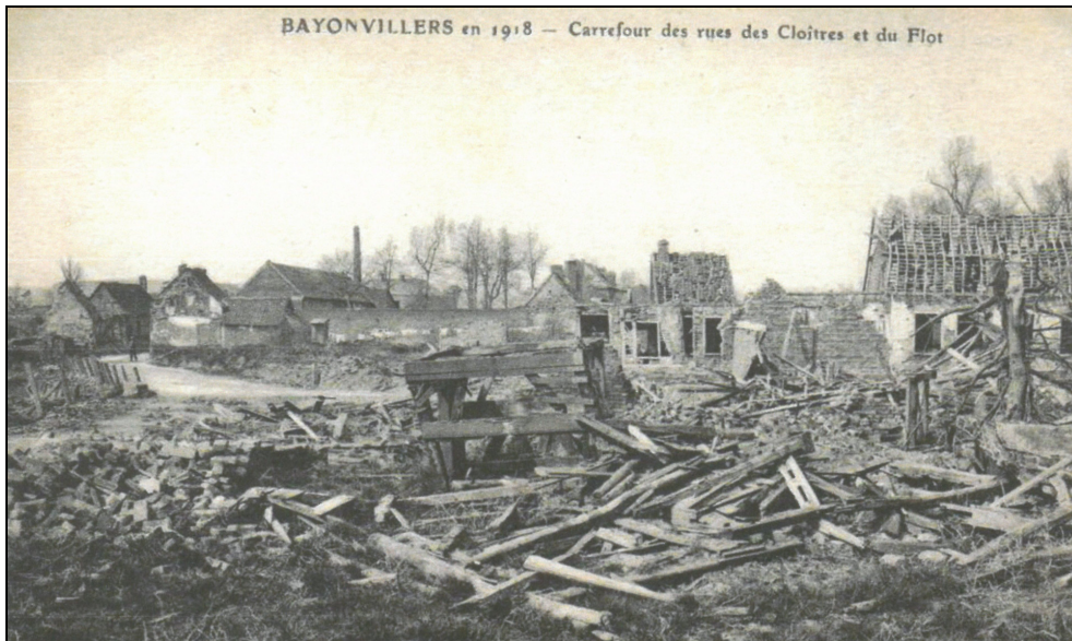
Bayonvillers, ville de cantonnement du régiment après la bataille