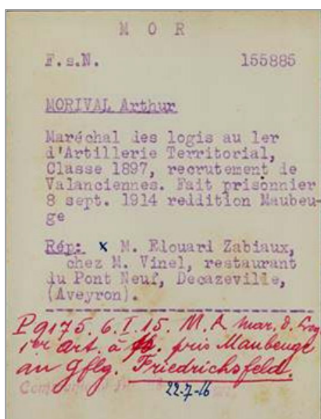
Fichier du CICR

➤ Fait prisonnier à Maubeuge le 7 septembre 1914