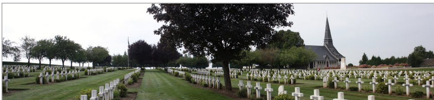
Nécropole nationale Rancourt (détail)