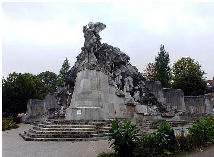
Monument aux Morts de Tourcoing 01/10/2016