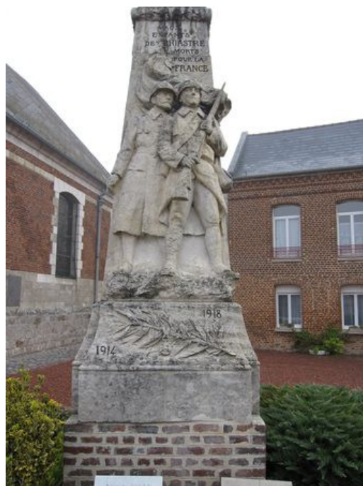
Son nom figure sur le Monument aux Morts 3 de Briastre (59)