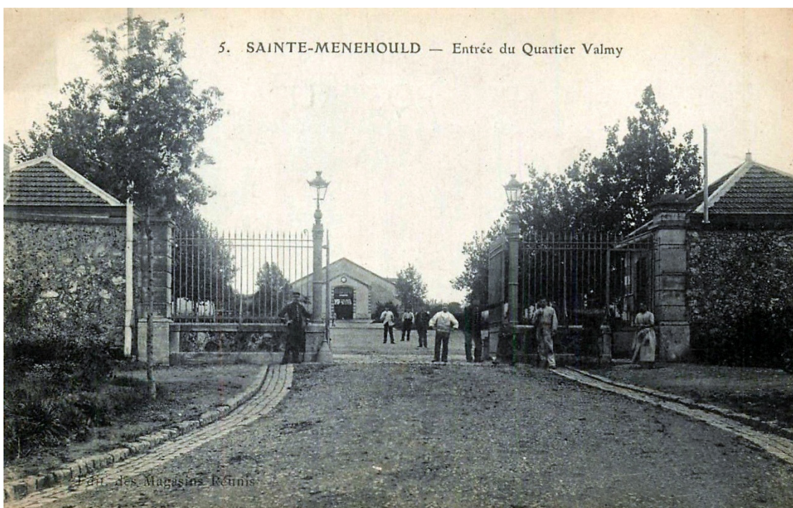
Le Quartier Valmy à Sainte-Menehould (Marne)

Après une période de repos en mars 1916 dans la région de Saint-Josse (Pas-de-Calais), le 66 e R.I. rejoint son nouveau secteur de combat. Pour cela, parti du secteur de l'Épine (Pas-de-Calais) le 31 mars il fait mouvement par voie de terre . Le 13 avril il embarque en chemin de fer à Ailly-sur-Noye (Somme). Troupe et officiers débarquent à Sainte-Menehould (Marne) le 14, cantonnement à la caserne Valmy.