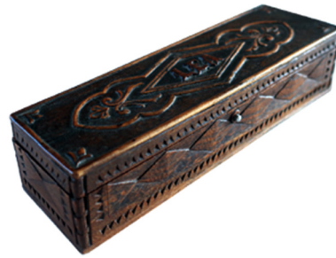
Le plumier de Léa