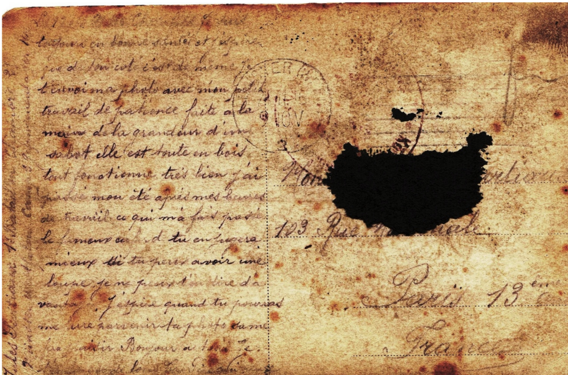
Carte-photo de Jules montrant son chef-d'œuvre.

Pour en savoir plus sur cette maquette, voir : http://agfh59.free.fr/memorial_14_18/agfh_1418_art_automobile.htm