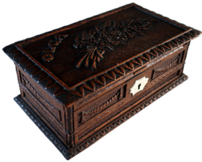
Le coffret à bijoux d'Olga