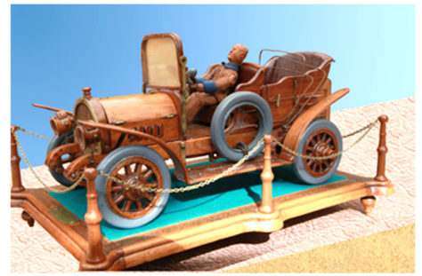
L'automobile de René

Pour admirer ces réalisations voir : http://agfh59.free.fr/memorial_14_18/agfh_1418_art.htm