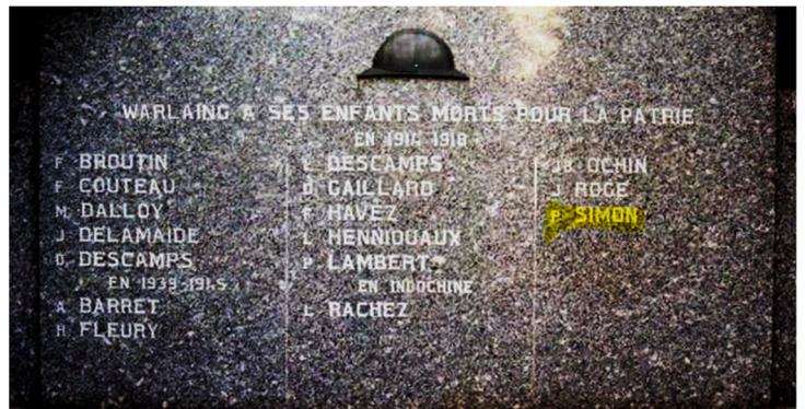
Monument aux Morts de Warlaing.